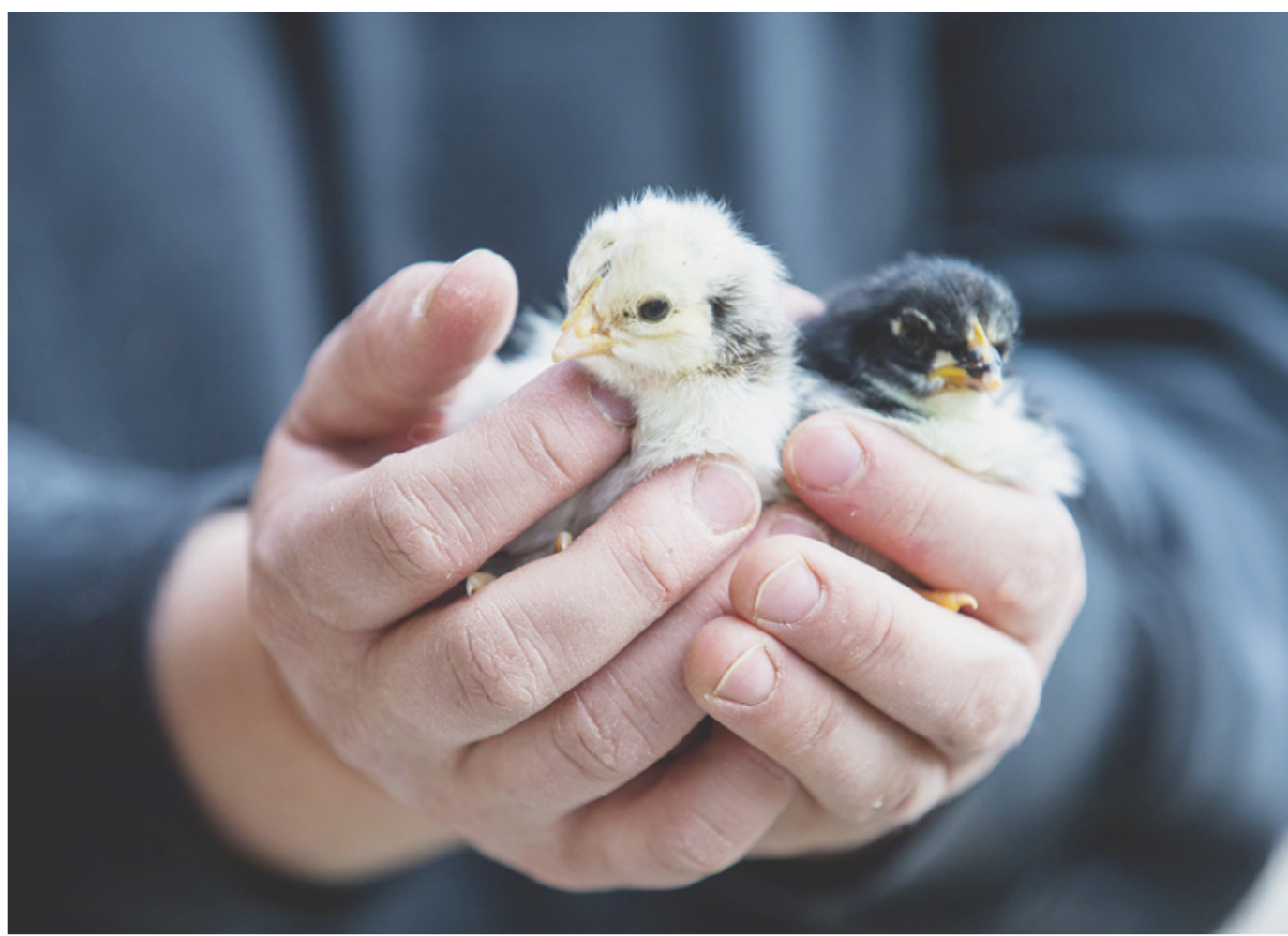
NOUVEAU-NÉS La Ferme des Morand, à Saint-Prex, a vu naître ces deux charmants poussins dans la nuit de mardi à mercredi. Ils ont aussitôt trouvé place dans le poulailler.