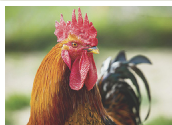
AUX AGUETS Le soleil revient mais pour ce coq exclu de lâcher la pression: il faut veiller au grain (Saint-Prex).