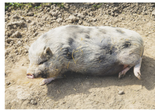
RELAX Pas de stress pour le cochon nain «Tupf», qui n'hésite pas à prendre le soleil de Saint-Prex.