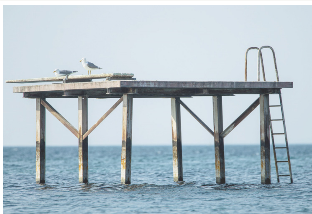
EN ATTENDANT Si tout se passe bien, la plage de Perroy sera d'ici quelques semaines à nouveau noire de monde. Mais en attendant que les enfants et les ados prennent d'assaut son plongeur, il profite aux mouettes.