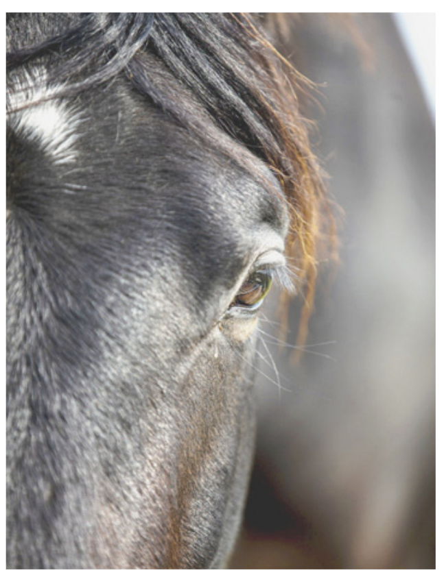
CURIEUX A Gland, de bon matin, ce cheval scrute les rares promeneurs empruntant le chemin du Stand.